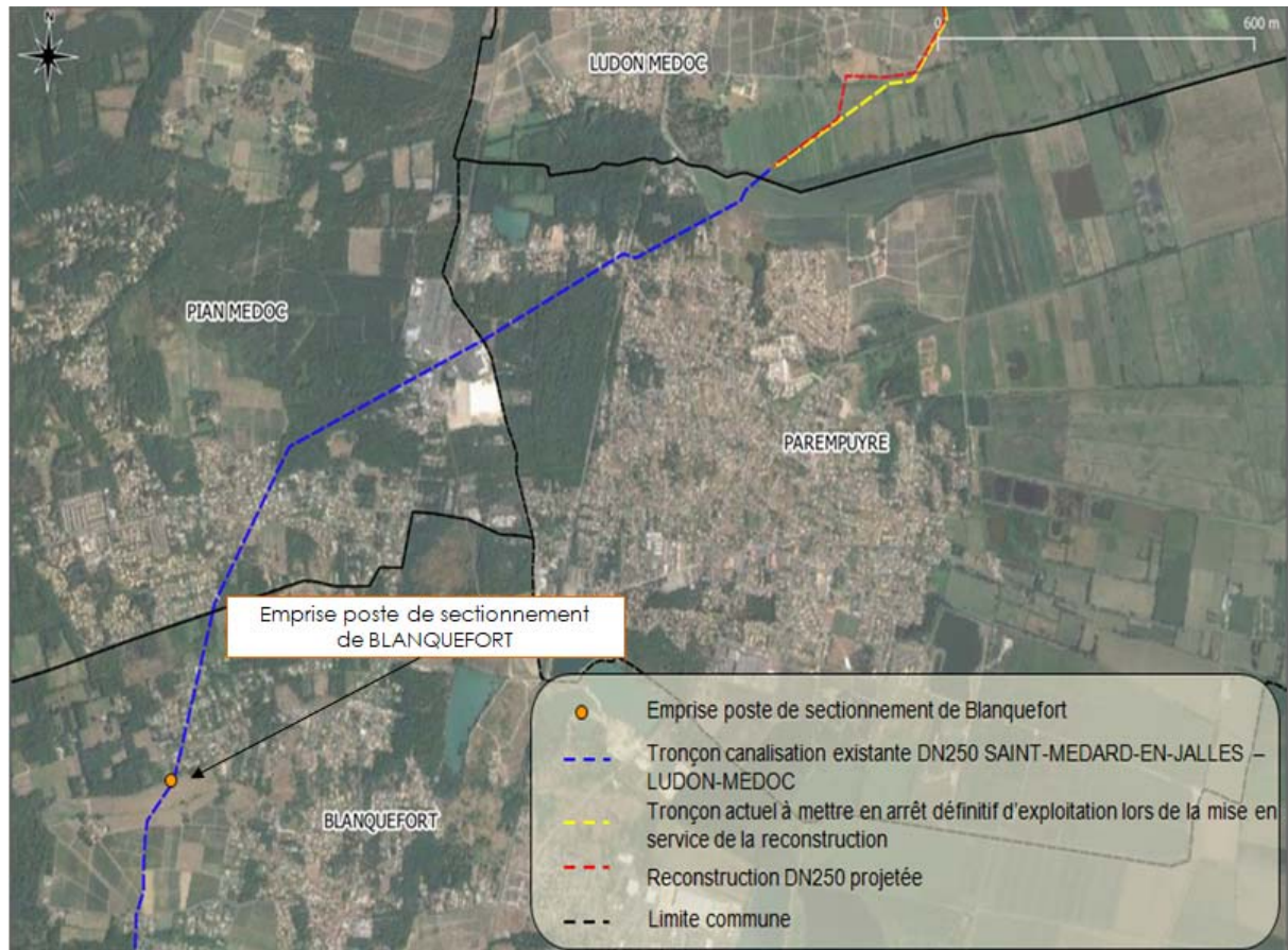
Figure 2 : Vues générales du tracé

Le présent dossier de demande d'autorisation préfectorale de construire et d'exploiter les canalisations de transport de gaz naturel est déposé à la préfecture de la Gironde (33).